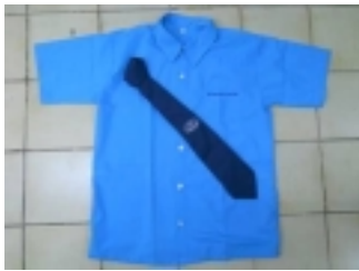
シャツとネクタイ